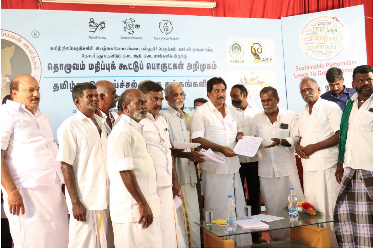
Release of brochure on IYRP by Minister of Commercial Tax, Tamil State Government on 29-10-2022